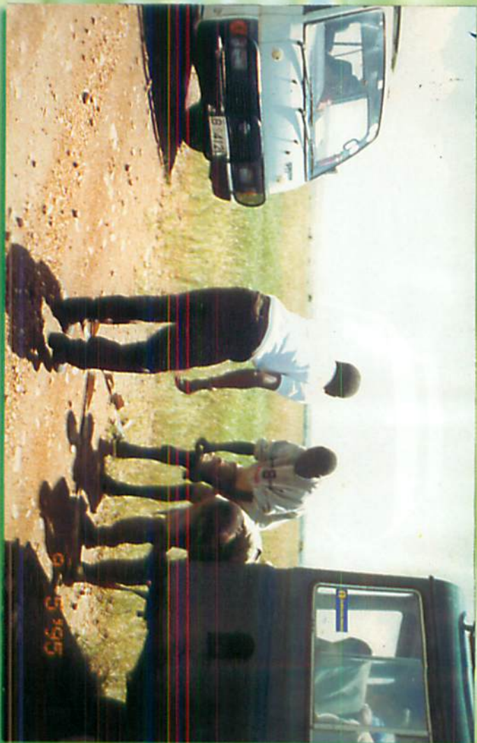
ချောင်းကိုင်ဖြတ်နိုင်ရန် စခန်းမှကားက ဆွဲဖို့ပြင်နေစဉ်