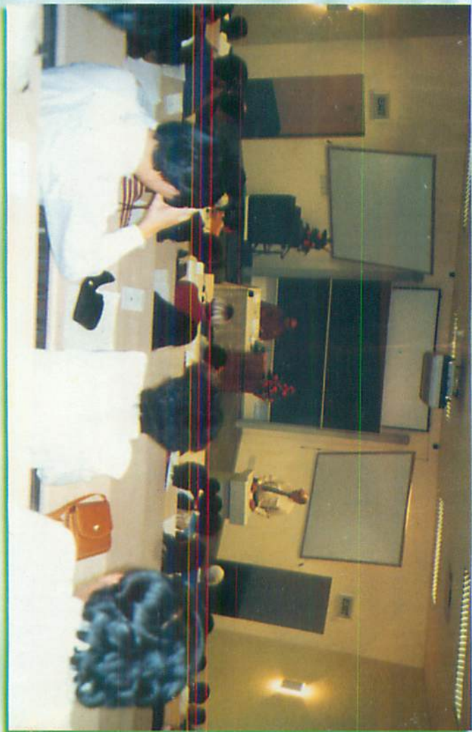
ဒါဘန်ဖြူ၊ တက်ခန့်ကွန်ကောလိပ်တရားပွဲ