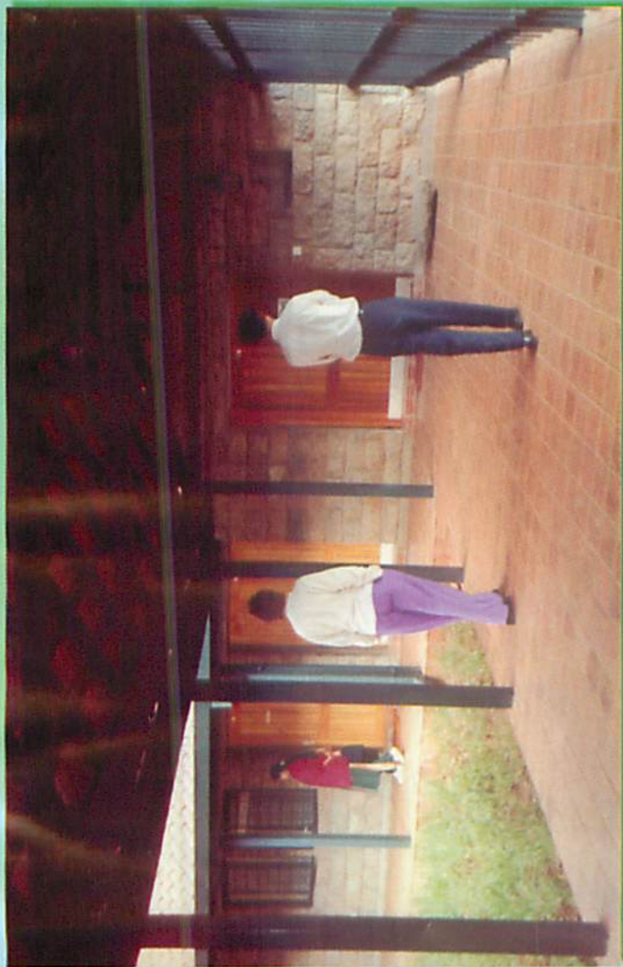
နိုင်ရောဘိတရားစခန်း၊ စင်္ကြံ လျှောက်အားထုတ်စဉ်