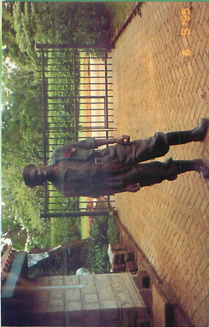
ကင်ညာဂိတ်စောင့်