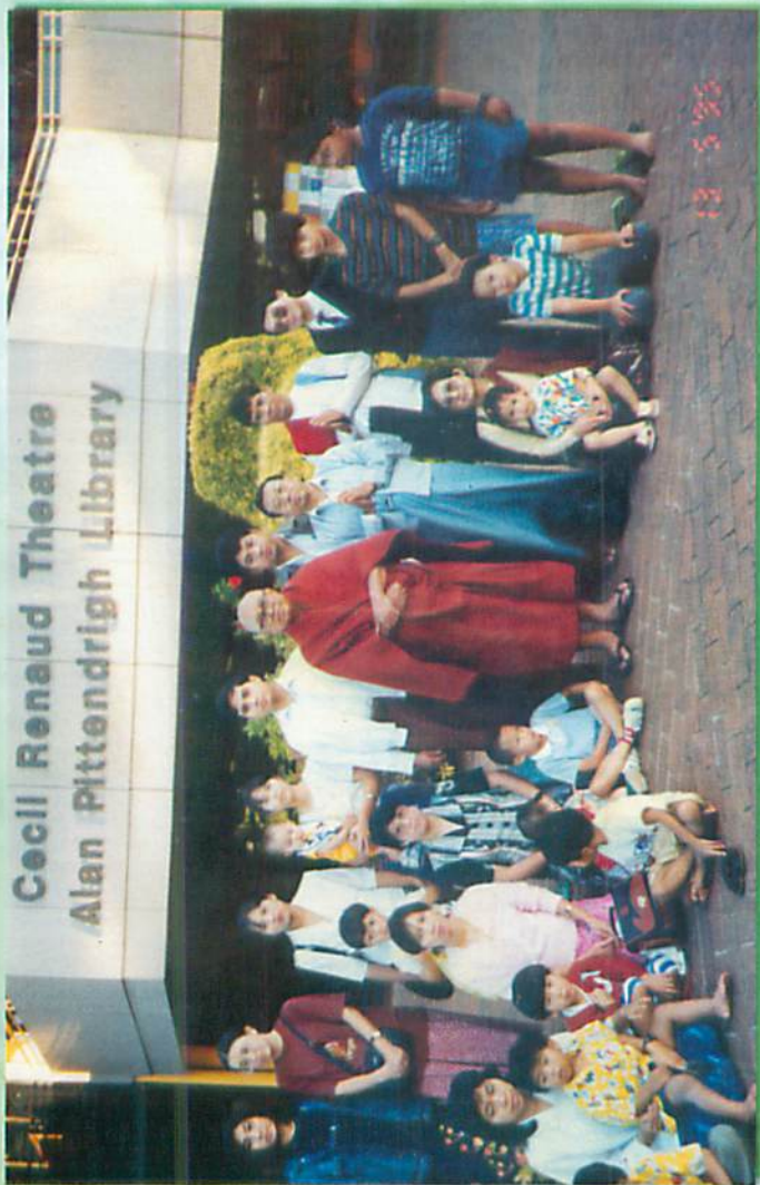
တက်ခနီကွန်ကောလိပ်၊ တရားပွဲအပြီး မြန်မာမိသားစုများ