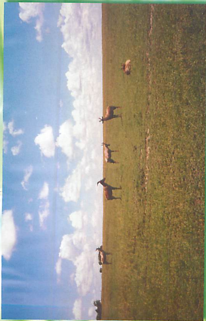
(Toppi) ခေတီသော ဆတ်တရျို: