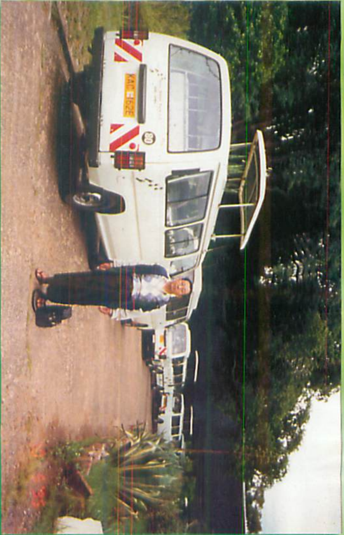
နိုင်ရောဘိသို့ပြန်ရန် စိတန်းနေကြသောကားများ