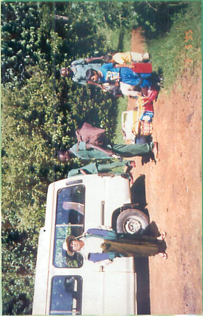
Governer's Camp ဘုရင်ခံ၏ စခန်းသာသို့ ရောက်ကြပြီ