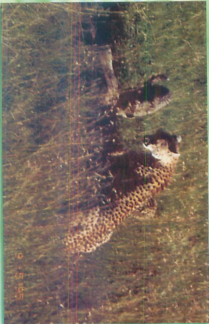
သားကောင်ကိုစားနေသော (Cheetah) ၏ ကျားသစ်ငယ်မိသားစု