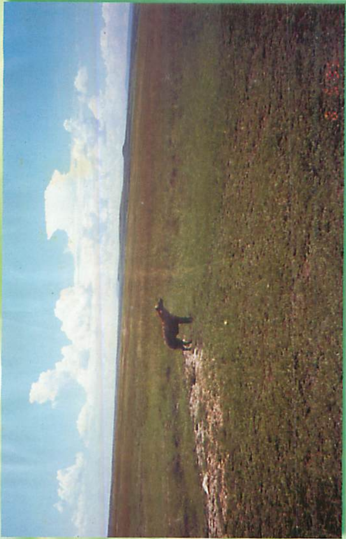
အဖေဖျော်နေသော အောင်(တရုတ္တ Hyena)