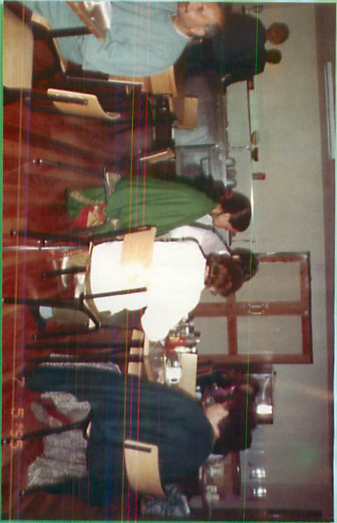
မိုင်းရောဘိတရားစခန်း၊ နံနက်စာသုံးဆောင်ကြစဉ်