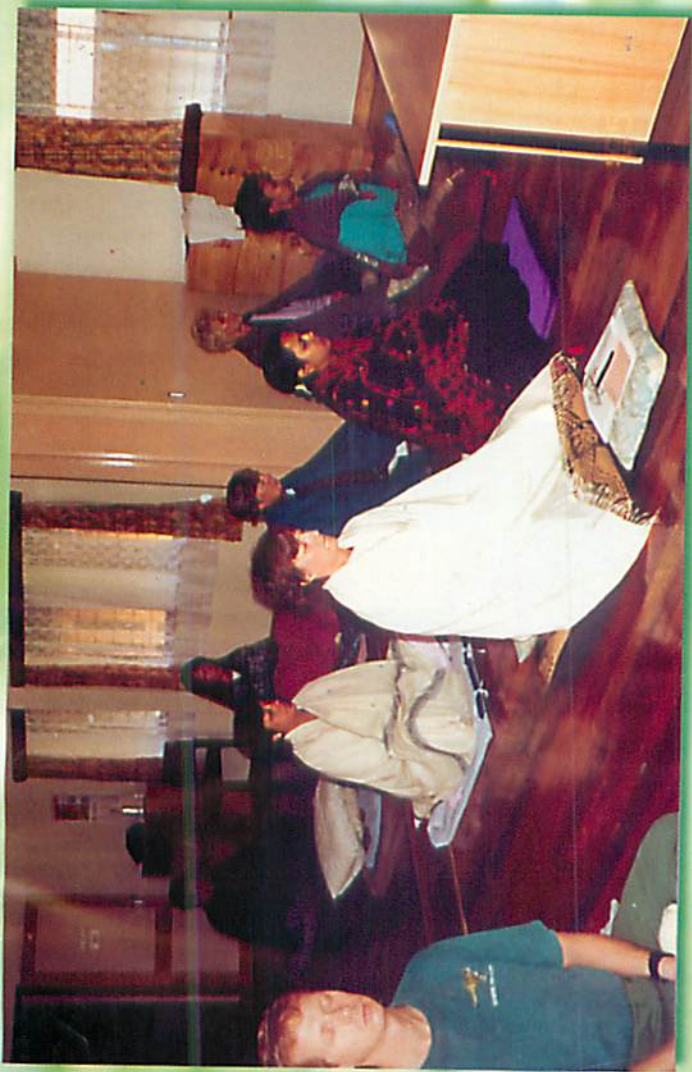
ဝိုင်ရော့ဘီတရားစခန်း