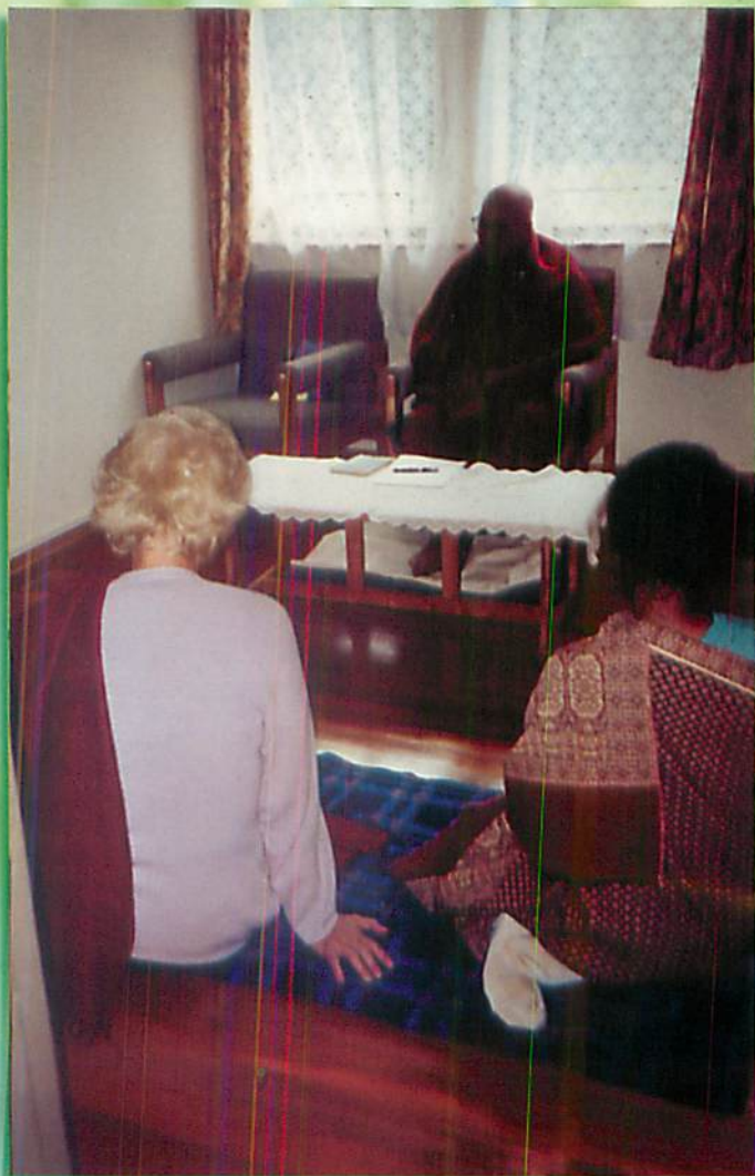
နိုင်ရောဘိတရားစခန်း၊ တရားလျှောက်ကြစဉ်