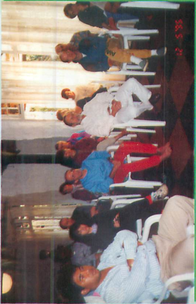
ပိတာမရိဇာတ်၊ အိဆိုပိတရားရိပ်သာ တရားနာရိသတ်