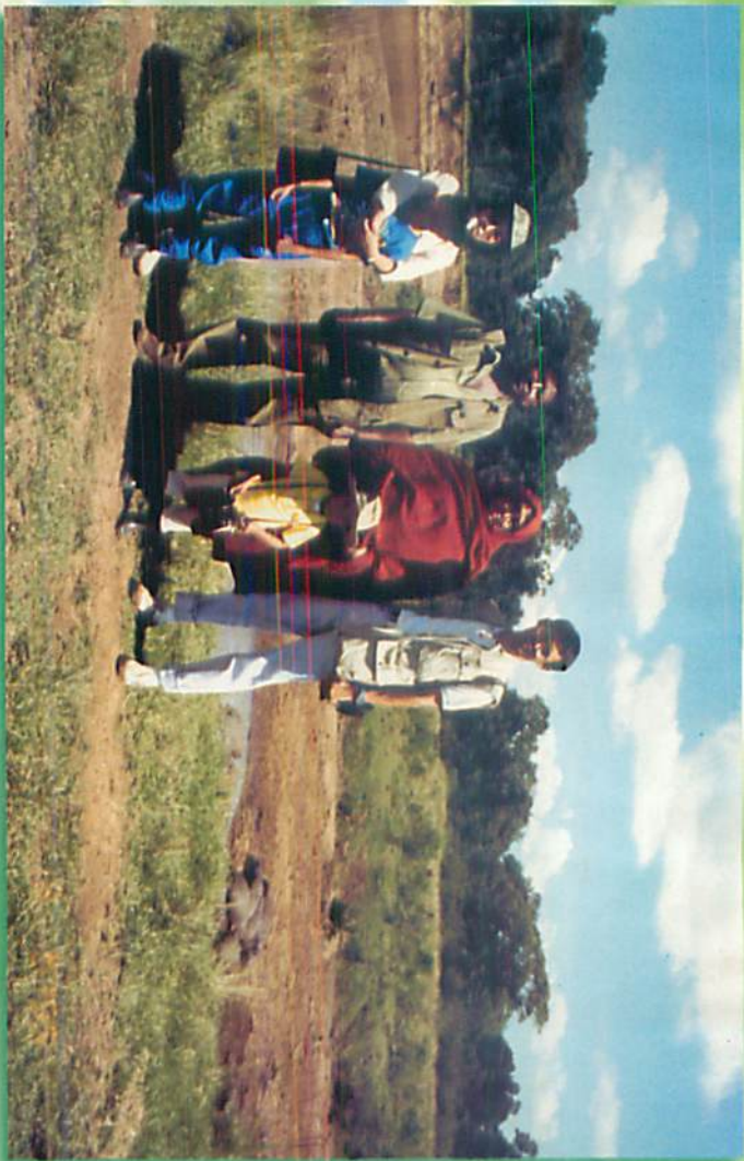
ရေမြင်းတို့ပျော်စရာ ချောင်းကမ်းပါးတနေရာ