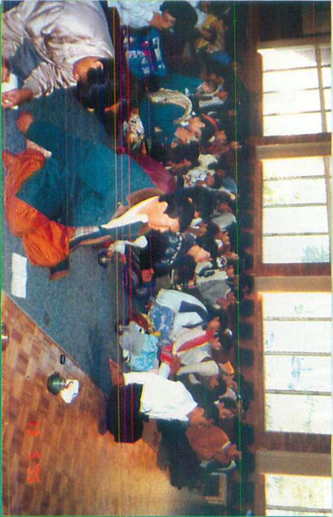
ပိတောက်ရိက္ခာတော် ကဆုန်လပြည့် ဗုဒ္ဓနေ့တရားပွဲ