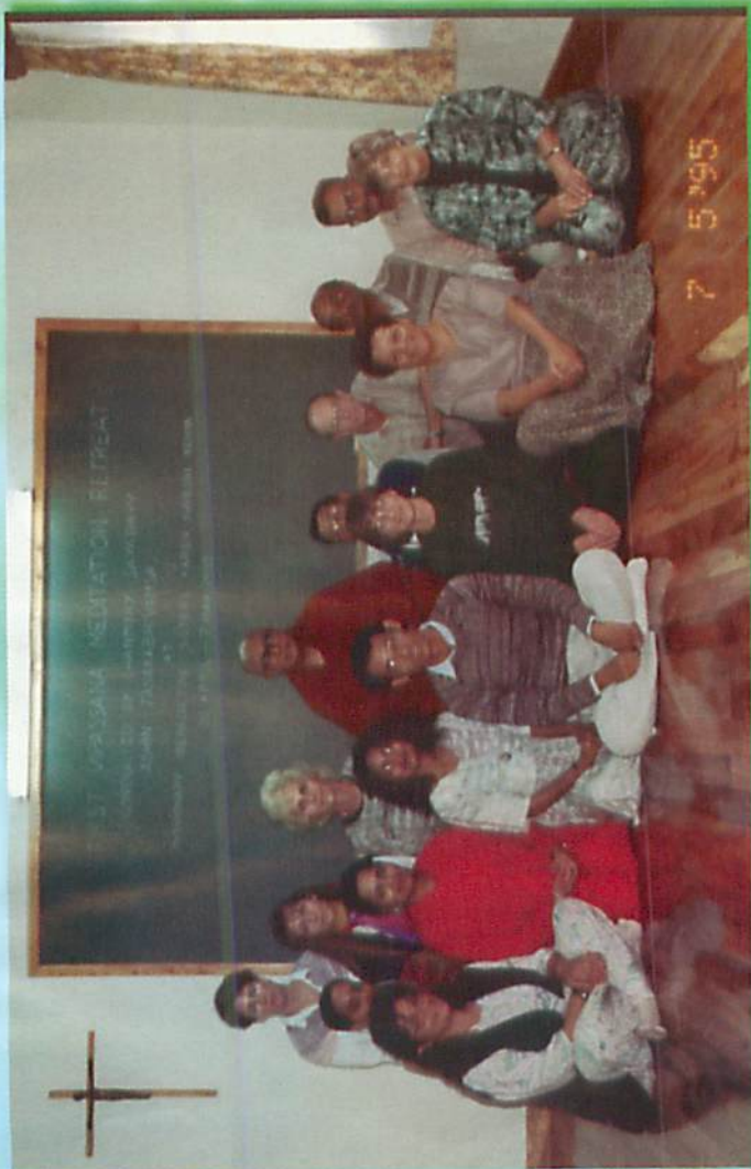
နိုင်ရောဘိ တရားစခန်းသိမ်း