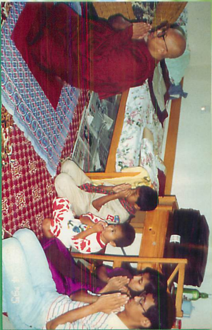
ဝိသုဒ္ဓိဘိက္ခုနီ၊ ဦးအေးကလေးတို့