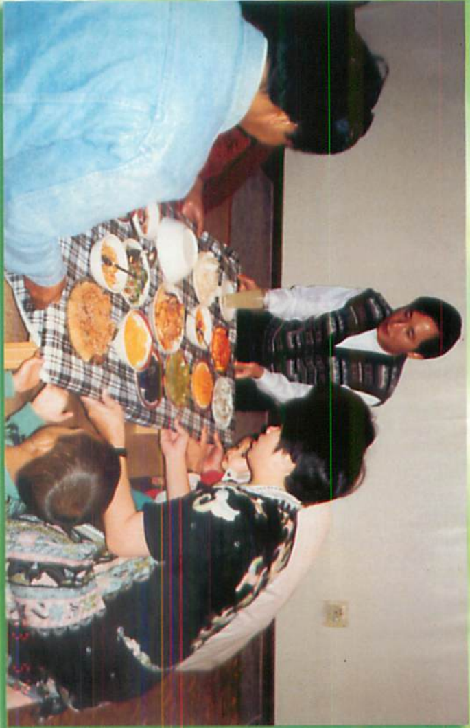
တောင်အာဖရိက၊ ပီတာမရိုဇဘတ်၌ စုပေါင်းဆွမ်းကပ်ကြစဉ်