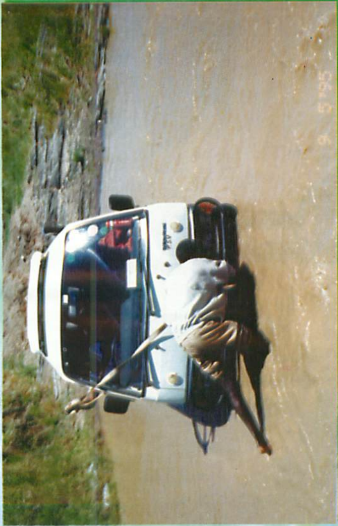
ဘေးမဲ့တောထဲ ရှောင်ဖြတ်စဉ်