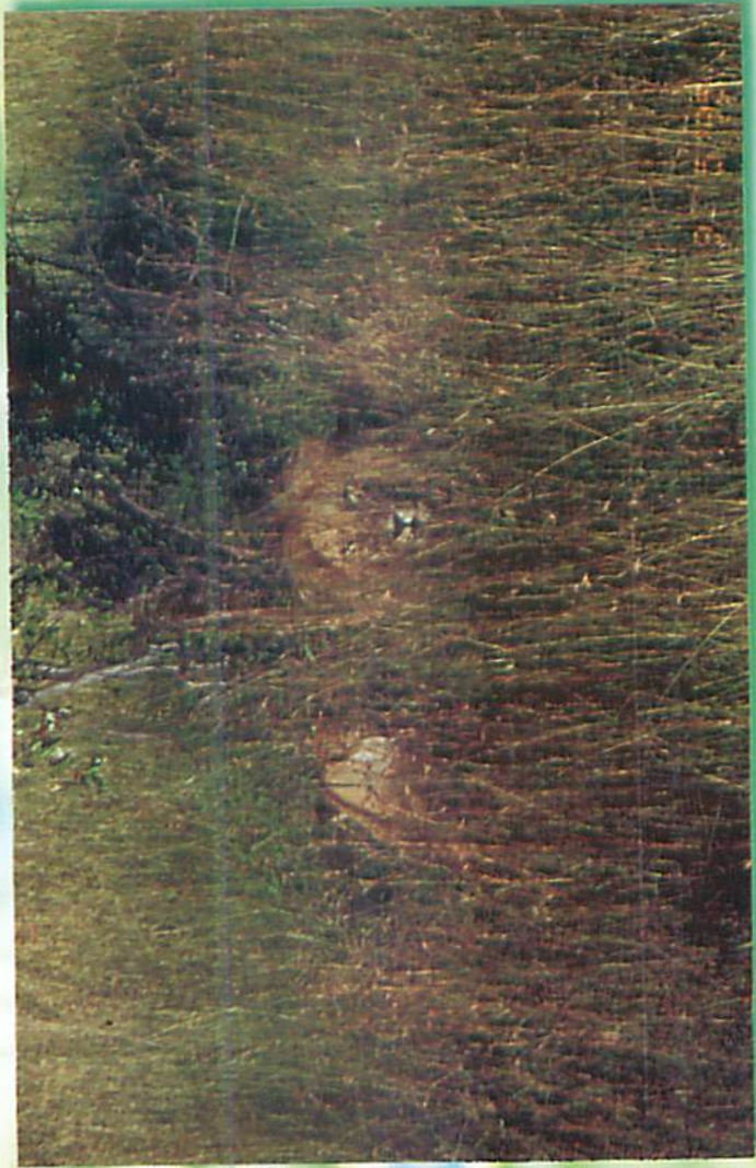
၄-ပေခန့်အထိ နိုးကပ်နေသော်လည်း မဖြူသော ခြင်္သေ့ဖိုမတစ်စုံ