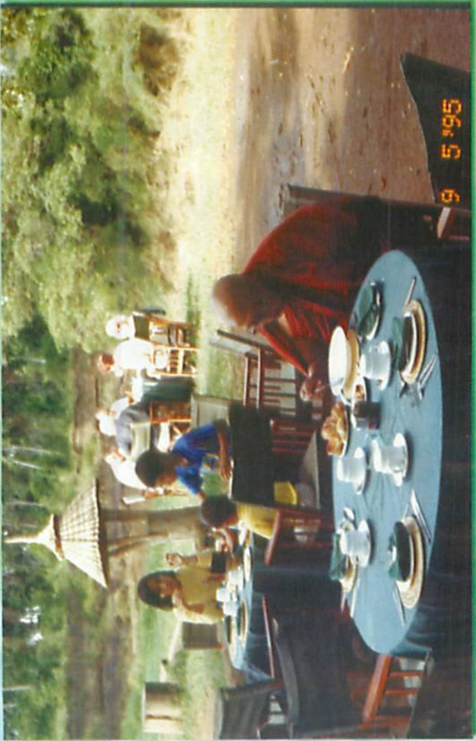
စခန်း၌ အရဟံဆွမ်းဘုဉ်းပေးစဉ်