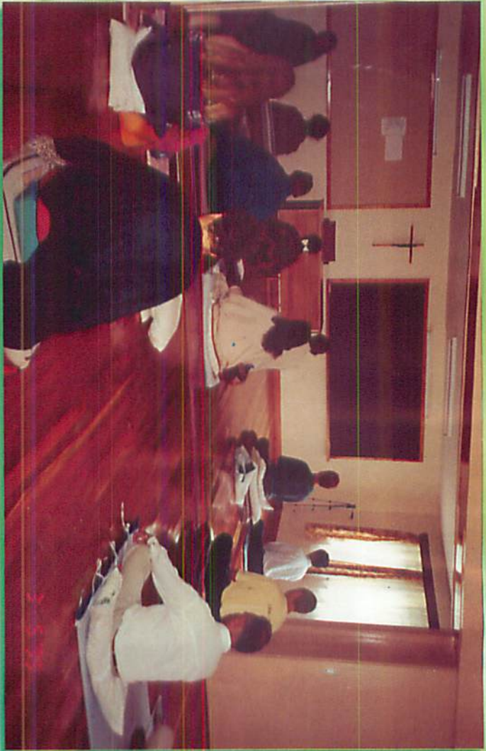
မိုင်ဂျော်တရားစာအုပ်