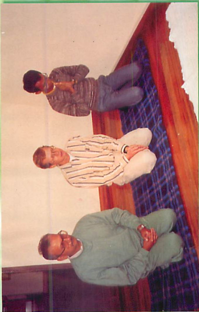
နိုင်ရောဘိတရားစခန်း၊ တရားလျှောက်ကြစဉ်