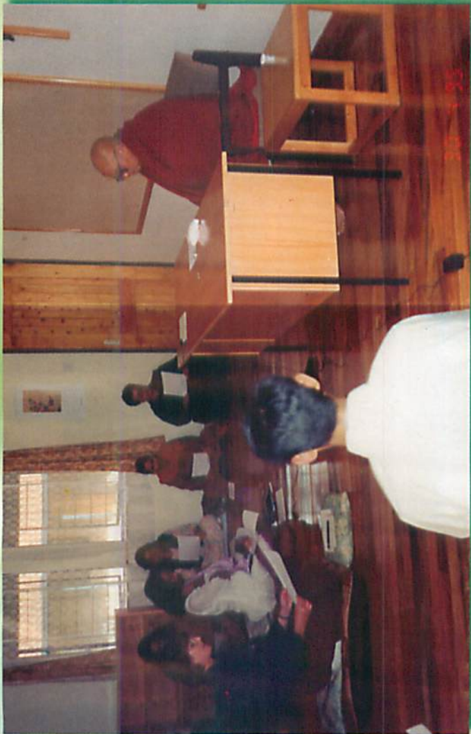
ယောဂီများအား တရားချီးမြှင့်စဉ်