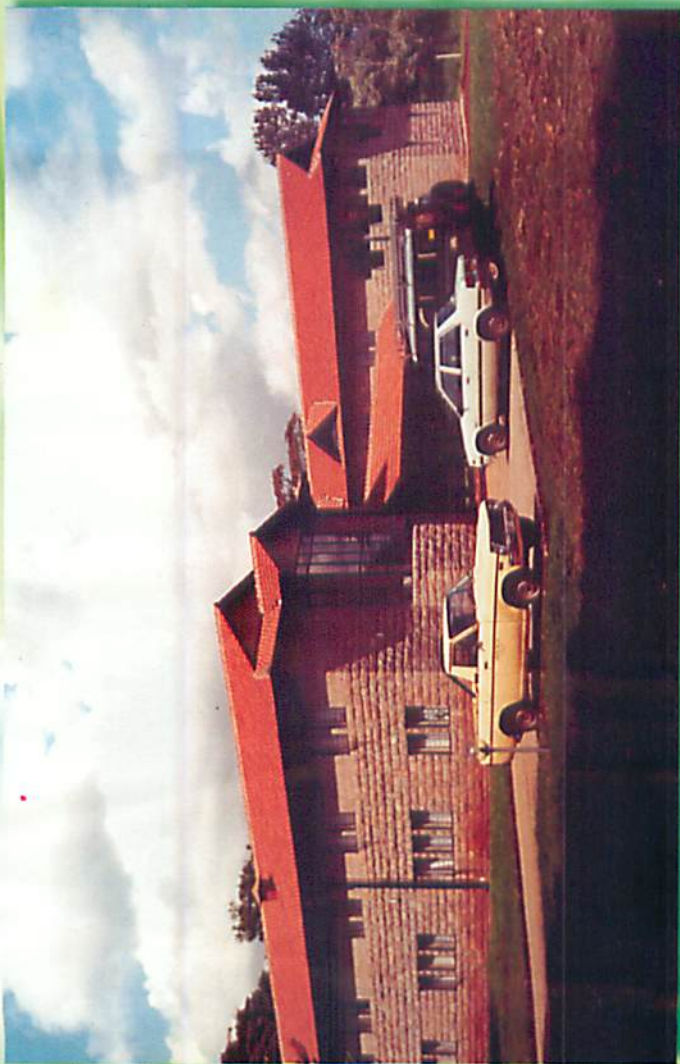
တရားစခန်း၊ တရားခန်းမနှင့် ယောဂီဆောင်